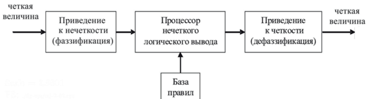
Рис. 1. Схема нечёткого логического вывода

Используемые для работы СНЛВ исходные данные представляются вектором X , определенным в