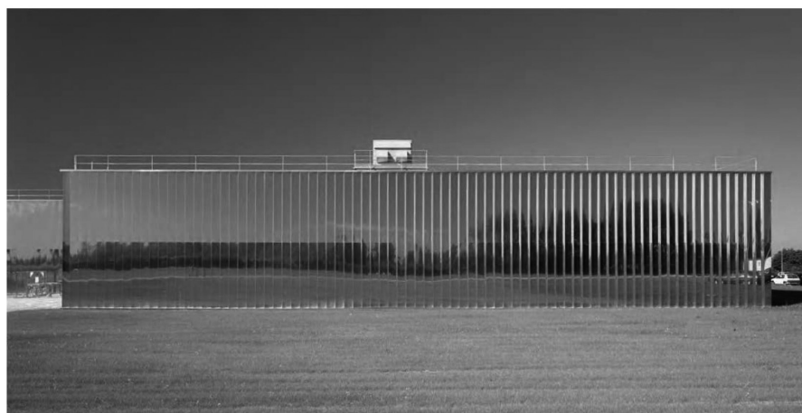
Рис. 3. Фабрика «Апликс». Общий вид

фоне окружающей среды и застройки, создавая более сильные образные эффекты и впечатляющие контрасты [10, С.204]. Протяженные и глухие фасады фабрики «Апликс» (арх. бюро Dominique Perrault Architecture, Франция, 1997-1999), полностью облицованные металлическими панелями с зеркальной поверхностью, формируют ультра-технологичный, но одновременно мистический и «безграничный» образ, который и контрастирует и сливается ее с природным окружением (рис.3) [11, Р. 134-135]. Однако, при необходимости создания производственной среды, сомасштабной человеку, сегментирование, изгибание и дробление поверхностей фасадов помога-