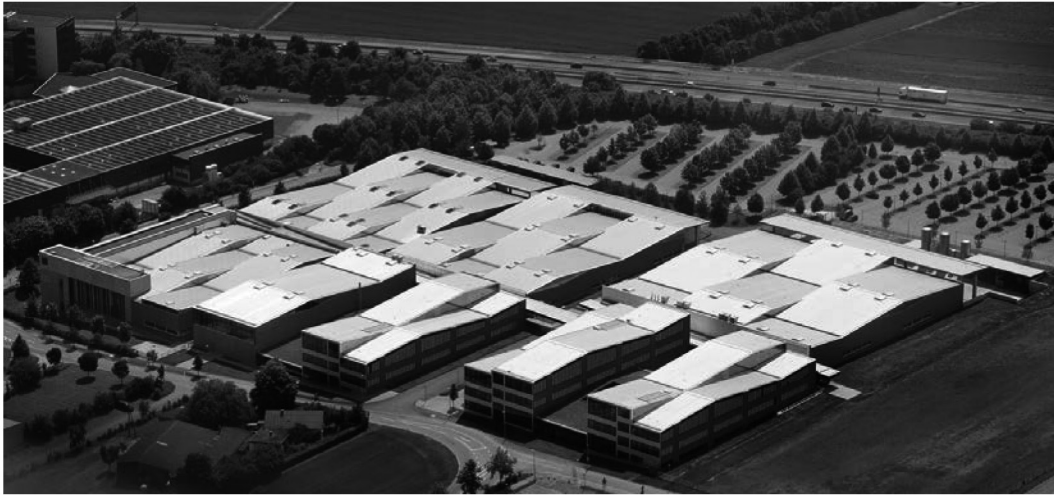
Рис. 1. Кампус «Трамф» в Дитцингене. Общий вид

По результатам исследования было определено, что поставленная цель и описанные выше функции эстетической выразительности новейших производственных объектов реализуются при помощи неширокого набора средств, рациональных для применения в экстерьере или в интерьере зданий, а также универсального приема – колористического подхода, который актуален как для внутренних, так и для наружных поверхностей.