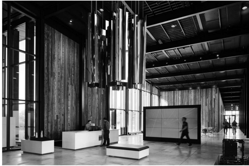
Рис. 5. «Умная фабрика Трамф». Интерьер