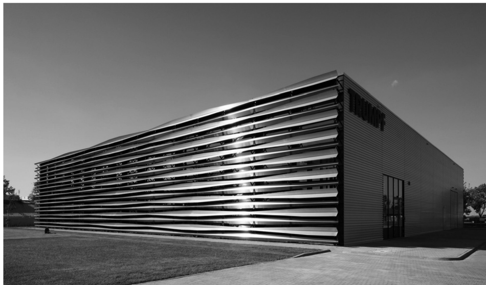
Рис. 2. Технологический центр «Трамф». Общий вид

ко защищают интерьер от солнечных лучей, но и придают динамичности внешнему виду лаконичного объекта (рис.2). Необходимо отметить, что эта солнцезащитная конструкция изготовлена из металла на оборудовании самой фирмы «Трамф» (высокоточные станки для лазерной резки), то есть эстетическое решение фасада одновременно служит и демонстрацией производственных возможностей предприятия.