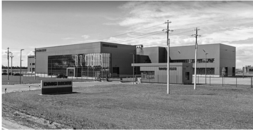
Рис. 4а. Станкостроительный завод «ДМГ Мори-Секи»