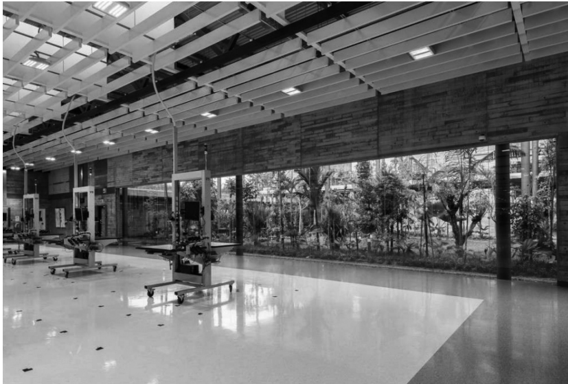
Рис. 7. Фабрика «Парамит». Интерьер

6. Конструктивные элементы и инженерные системы подвергаются эстетической интерпретации и не скрываются за подвесными потолками, а многочисленные трубопроводы и кабельные трассы образуют строгие метрические композиции. Например, в здании «фабрики на Земле» (арх. бюро Ryuichi Ashizawa Architect & Associates, Малайзия, 2013) брутальные железобетонные капители были выполнены в форме шестиконечных звезд (рис.6). Особое внимание также уделяется дизайну осветительных приборов, заборных и приточных устройств. На «инновационной фабрике Брюннер» (арх. бюро G. Henn Architekten, Германия, 2018) в производственной зоне реализован интересный прием по инсталляции элементов освещения в несущие конструкции покрытия, выполненные из клееной древесины.