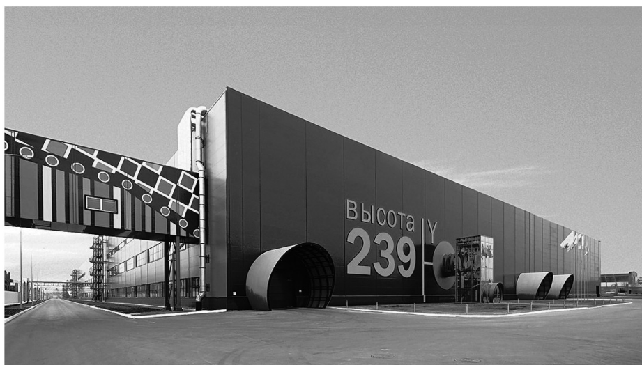
Рис. 8б. ЧТПЗ «Высота 239». Внешний вид

для промышленных объектов, и усиливает светотеневые эффекты на волнообразных акриловых панелях фасада. В качестве примера монохромного решения интерьера можно привести здание фармацевтического предприятия «Генхеликс Биофармасьютикал» (арх. бюро estudioSIC, Испания, 2011), интерьеры которого также полностью выкрашены в белый цвет.