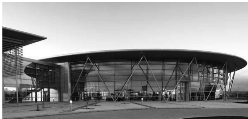
Рис. 4б. «Фабрики 2050»

ет визуально уменьшить объемы производственных объектов. Например, подобным образом решен фасад лазерной фабрики «ХААС» (арх. бюро Varchow Leibinger Architects, Германия, 2000), состоящий из унифицированных панелей, установленных под небольшими разными углами к плоскости фасада.