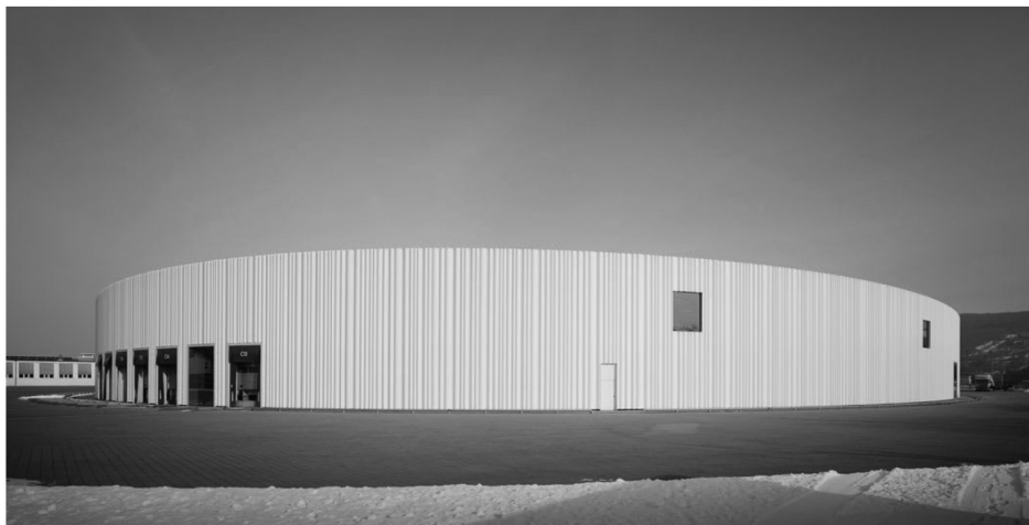
Рис. 8а. Дистрибуторский центр «Витра». Внешний вид