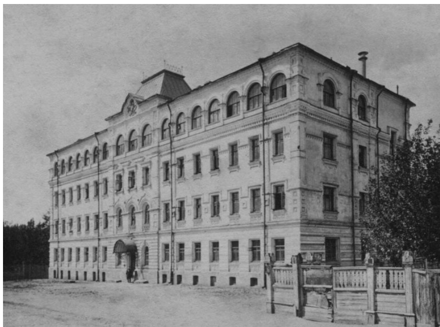
Рис. 2. Контрольная палата в Москве. Архитектор А.Е. Вебер при участии И.Е. Бондаренко. 1899 г. Верхний этаж надстроен по проекту И.С. Кузнецова в 1911 г.

за постройкой Московской духовной консистории (1897) (рис. 2). По поводу работы помощником Сретенского и Попова И.Е. Бондаренко в воспоминаниях сетовал: «Пришлось перестроить свои навыки, полученные в Швейцарии на русские, в то время такие отсталые, даже в приемах черчения» [20, с. 192]. Тогда было трудно повлиять на происходящее, и архитектор утверждал: «ввести что-либо новое требовало большого напора» [20, с. 192]. Кстати, писал он и о коррупции в строительстве, процветавшей тогда в России. В частности, подрядчикам приходилось платить «комиссионные» 1 [15, с. 386]. Об отношении к процессу проектирования во второй половине XIX в. И.Е. Бондаренко вспоминал: «Говорить о каком-либо художественном направлении было бы неуместно. От нас требовалось только уметь ловко вклеить кокошник или наличник на безличную основную массу, и это называлось “русским стилем”» [15, с. 384].