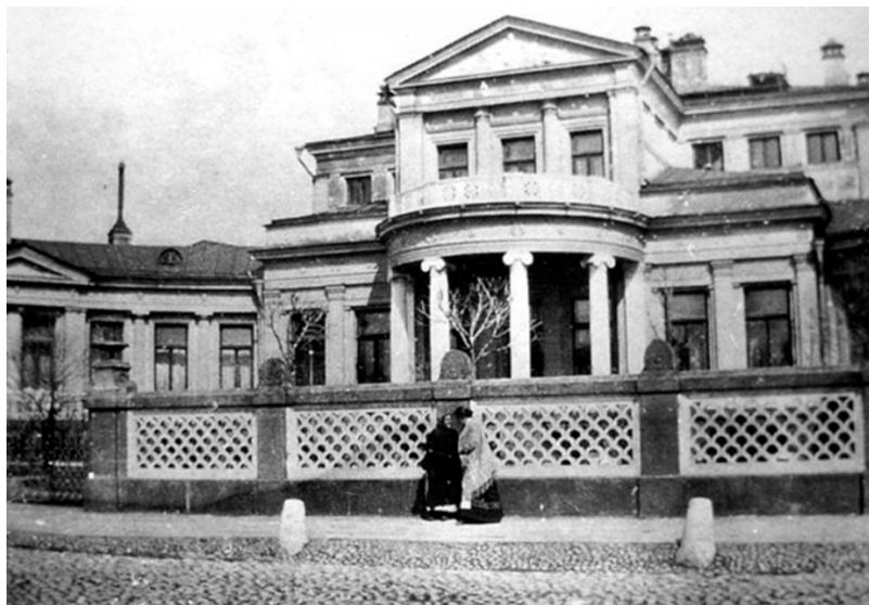
Рис. 4. Особняк М.К. Морозовой (К.С. Попова) на Смоленском бульваре в Москве.

видный московский архитектор 1840–1850-х годов: «...эклектик, с уклоном позднего классицизма, хотя и ученик Джилярди (представителя московского ампира), но уже утратил то искусство и подражал более Шинкелю» [22, с. 13] (рис. 4).