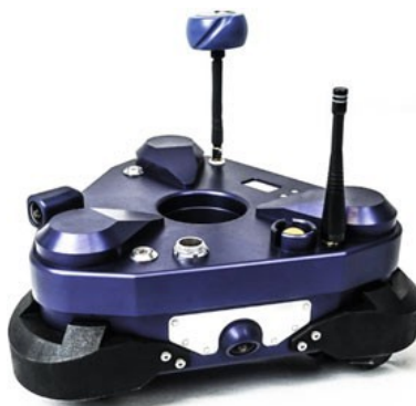
Рис. 4 TRIC (трехколесный инспекционный гусеничный сканер), установленный в дроне AeroX

Однако, есть некоторые проблемы, которые необходимо решить. Первая заключается в поддержании контакта с рабочим прибором, установленным на БПЛА в местах освидетельствования. Во-вторых, требуется подавлять возмущения, вызванные ветром и аэродинамическими эффектами, создаваемыми близлежащими поверхностями. Кроме того, во многих случаях очень важно иметь достаточную точность позиционирования рабочего прибора. Позиционирование должно выполняться и при условиях, когда отсутствует GNSS (например, под мостом), и в местах, где отсутствуют маркеры или маяки. Кроме того, необходимо предусмотреть меры, компенсирующие последствия столкновений и неожиданных контактов с поверхностями. При этом рабочий прибор манипулятора на борту летательного робота должен поддерживать контакт с обрабатываемой