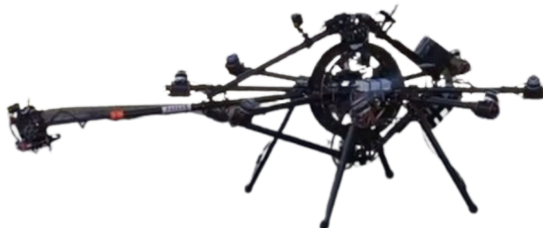
Рис. 3 Дрон AeroX, с манипулятором

осмотру, с помощью тросов, кранов или строительных лесов. В таких ситуациях применение воздушных роботов (рис. 3, 4) очень актуально. С их помощью возможно [14] обнаружение, точная локализация и измерение повреждений.