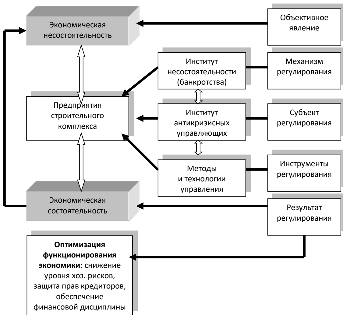
Рис. 1. Системное управление процессом экономической несостоятельности организации строительного комплекса (схематическое изображение)

Нынешняя оценка экономической несостоятельности предприятий строительного комплекса представляет лишь констатацию факта неплатежеспособности. Она не позволяет объективно оценить возможности предприятия по восстановлению платежеспособности. Под несостоятельностью понимается лишь финансовая несостоятельность – результат неудачного управления финансами. Не умаляя роли финансовой деятельности предприятия, следует признать, что финансовая несостоятельность может быть результатом плохого управления финансами, но, скорее всего, это результат низкого уровня управления и организации производственного процесса, неумелой маркетинговой, ценовой, затратной политики и так далее. Поэтому при оценке